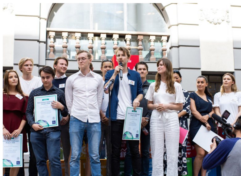
Prisceremoni under Global Challenges Expo.